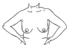
C) Manos en la cadera