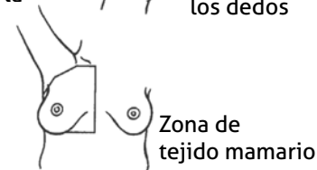
Zona de tejido mamario