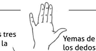
Yemas de los dedos